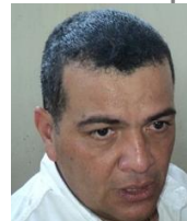
Jefe de la Oficina Operadora

La dirección de la Oficina Operadora es calle Correos número 169, colonia Centro, C.P. 96340, Cosoleacaque, Ver., y cuenta con el sitio web http://187.174.252.244/caev/Oficinas_Operadoras/Cosoleacaque/ .